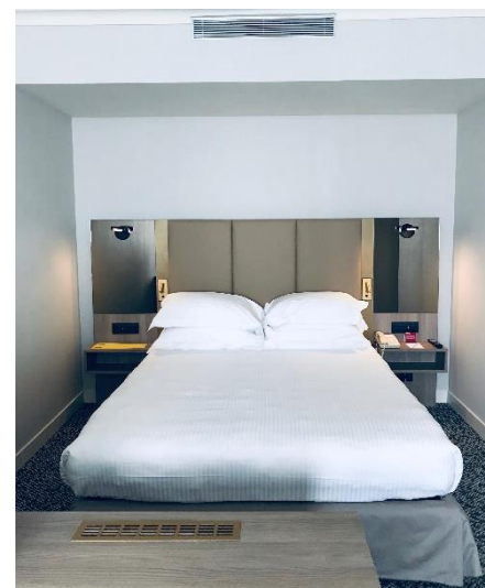
Hôtel Crowne Plaza – Milan – Réalisation Korus