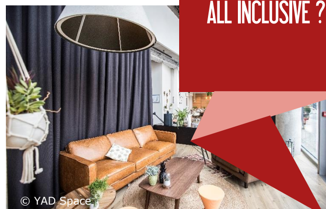
Restaurant Le Modjo by Wojo (anciennement Nextdoor) – Lyon – Réalisation Korus